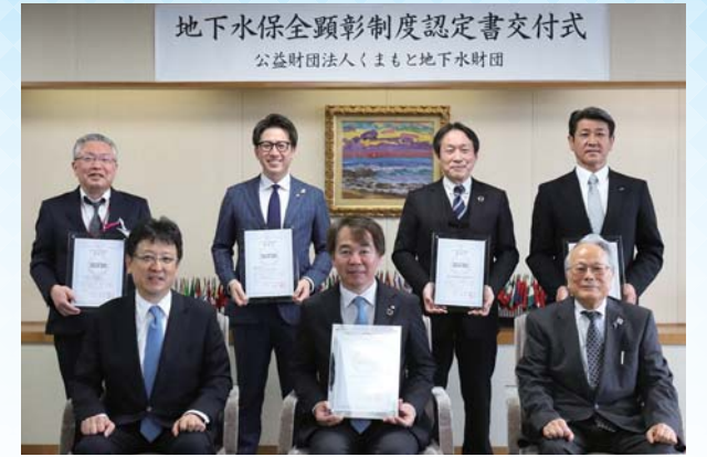
地下水保全顕彰制度認定書交付式