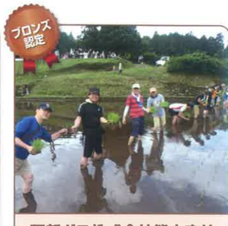
西部ガス株式会社熊本支社

今回認定された企業においても、今まで認定を受けた企業・団体と同様に、使用した地下水量を賄うためのかん養の取り組みや節水活動への参画など、様々な地下水保全活動を実践されており、今回ブロンズとして認定させていただくこととなりました。