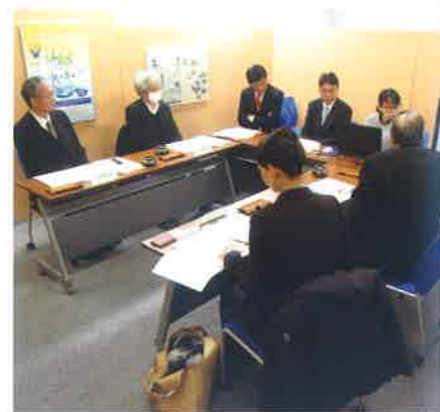
顕彰委員会審査の様子

平成29年1月20日(金)に地下水保全顕彰委員会を開催し、審査の結果以下のように平成28年度の認定企業が決定しました。