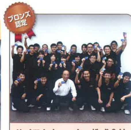
ハイコムウォーター株式会社