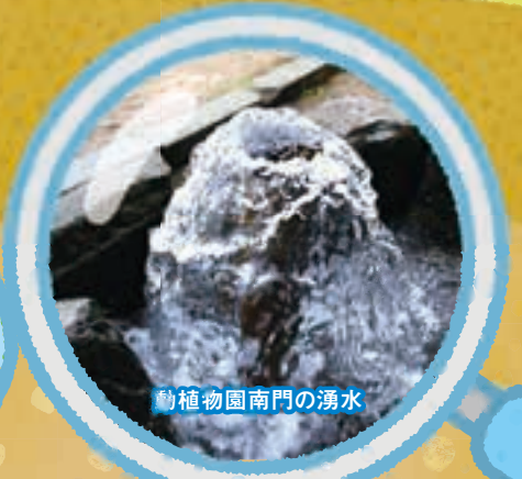
動植物園南門の湧水