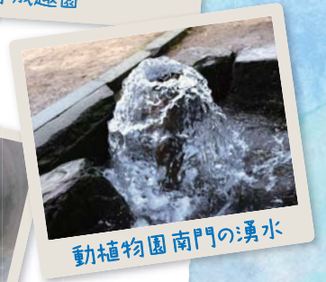
動植物園南門の湧水