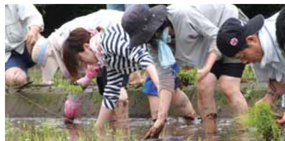
平成25年度水田オーナーモデル事業の様子

平成26年度は、多くの企業・団体の参加をいただき、水田オーナー制度を開始します！「今後やってみたい！」など、ご興味のある企業・団体の担当者様がいらっしゃいましたら、当財団が契約している田んぼで米づくりを行ってみませんか？