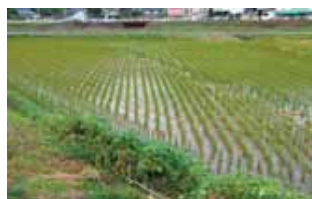
益城町金山川下流域

冬期湛水には、生物の多様化により、土が豊かになる事や雑草が育ちにくくなるなどの効果があるとされており、地下水のかん養だけでなく、環境保全型農業の促進にもつながります。