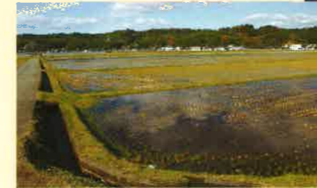
写真:益城町金山川下流域における湛水田の様子